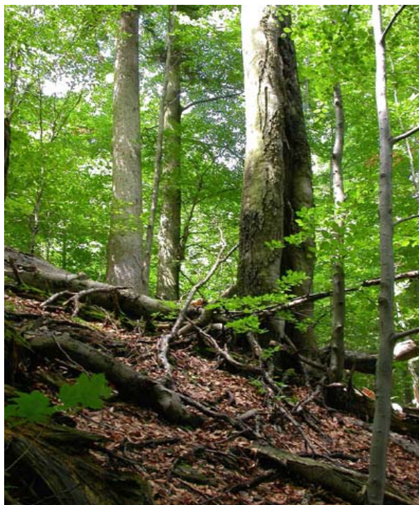
Obr. 2. Pohled do interiéru jedlobukového pralesa na východním svahu v okolí lokality č. 3. Na padlých kmenech se hojně vyskytuje ohrožená závornatka Macrogastera latestriata .

Číslo lokalit uvedené v tabulce 1 označují: 1 – údolí Menšího potoka za místem kde začíná být na hranici NPR (49°31'49,9" N, 18°40'04,9" E); 2 – prales 250 m nad Menším potokem, za jeho 2. levostranným přítokem (49°31'46,7" N, 18°40'01,1" E); 3 – NPR Mionší, suťové lesy na východním svahu 500 m východně pod Velkou Polanou (49°32'06,4" N, 18°39'43,4" E); 4 – suťový les 240 m jihozápadně pod Velkou Polanou (49°32'00,0" N, 18°39'09,5" E); 5 – staré suťové lesy východně pod Přelačkou (49°31'46,3" N, 18°39'50,4" E); 6 – Jazyk – otevřený průsakový kotlík 200 m severovýchodně Přelačky (49°31'49,4" N, 18°39'47,8" E); 7 – suťové lesy a průsaky na severovýchodním svahu jižního cípu NPR (49°31'24,9" N, 18°40'06,5" E); 8 – Velká Polana, louka okolo kóty (49°32'02,4" N, 18°39'20,6" E); 9 – louka nad Menším potokem 550 m severoseverozápadně pod Úplazem (49°31'30,1" N, 18°40'07,5" E).