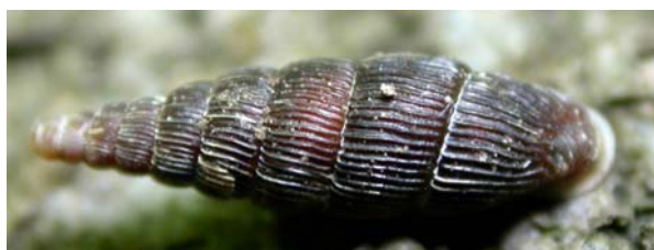
Obr. 3. Macrogastra latestriata – bližšie viz kapitola „Komentář k vybraným druhům“.

Macrogastra latestriata – kriticky ohrožený karpatský druh (Obr. 3), který má na našem území západní hranici rozšíření a je u nás svým výskytem vázán pouze na nejzachovalejší pralesní porosty. Prozatím je u nás znám celkem z 9 lokalit (Moravskoslezské Beskydy – 7, Oderské vrchy – 1, Vsetínské vrchy – 1, HORSÁK 2005). V Mionší se vyskytuje nejrozsáhlejší a z hlediska zachovalosti stanoviště také nejstabilnější populace tohoto druhu v ČR. Extrémně vysoké denzity byly pozorovány zejména na východním svahu, na místech s vysokým podílem padlých kmenů.