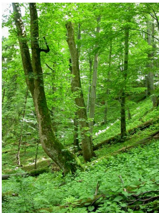
Obř. 1. Pohled suťového lesa s hojnými starými javory kleny (lokalita č. 5). Na tyto stromy jsou vázány svým výskytem jinak v rezervaci poměrně vzácné závořnatky Cochlodina orthostoma a Clausilia dubia .