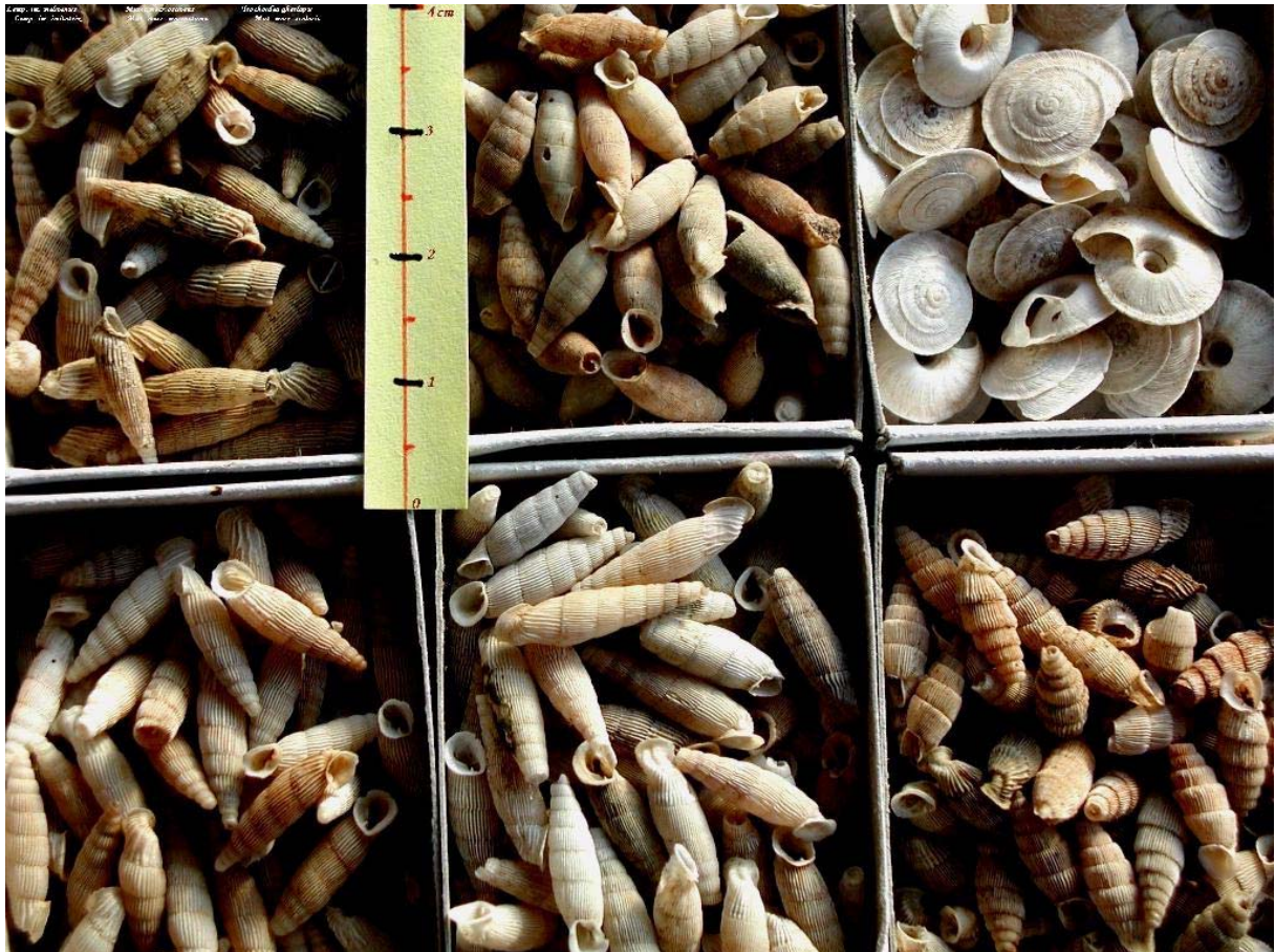
Obr. 2. Maltské endemity. Horní řada zleva: Lampedusa imitatrix melitensis , Muticaria macrostoma oscitans , Trochoidea gharlapsi . Dolní řada zleva: Lampedusa imitatrix imitatrix , Muticaria macrostoma macrostoma , Muticaria macrostoma scalaris .